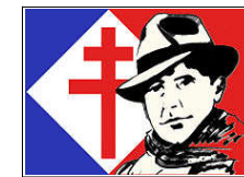
Figure phare de la Résistance française lors de la Seconde Guerre mondiale. À lui seul, il a organisé et unifié la Résistance au sein du CNR. Convaincu de son devoir de lutte contre l'occupant, il se rend à Londres pour rencontrer le général de Gaulle, en 1941. Les deux hommes ne tardent pas à s'accorder leur confiance et Jean Moulin se voit confier la lourde tâche d'unifier la Résistance dans le Sud de la France. Le 21 juin 1943, Jean Moulin est emprisonné à Lyon et torturé pendant plusieurs jours. Malgré les souffrances abominables qu'il endure, jamais

il ne donnera une quelconque information sur le mouvement qu'il a mis en place. Il meurt lors de son transfert en Allemagne, le 8 juillet 1943. Ses cendres reposent au Panthéon depuis 1964 et son combat héroïque reste à jamais ancré dans l'Histoire.